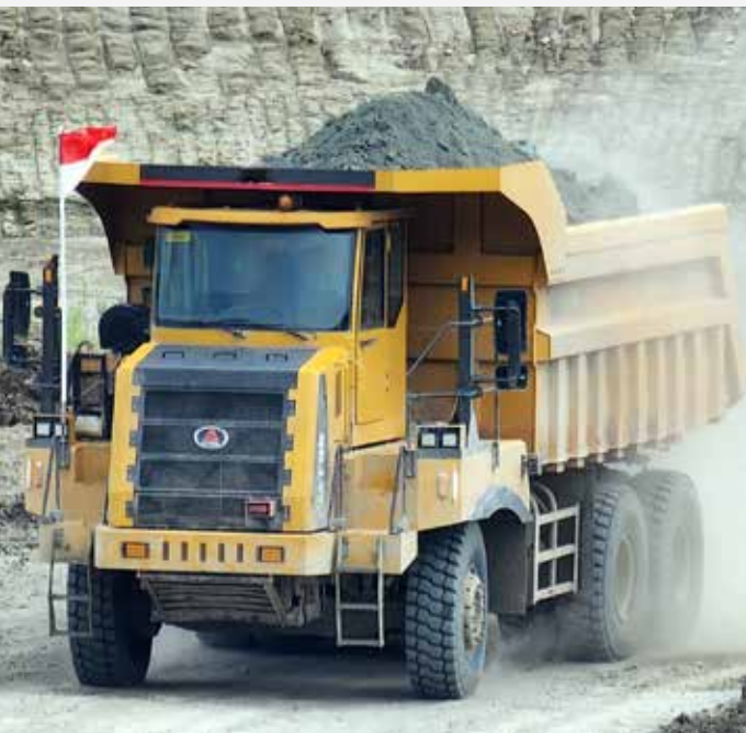
Proses Pengangkutan Batubara (Jambi Prima Coal)