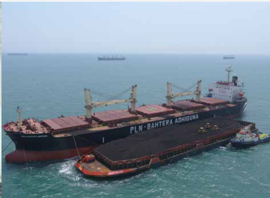
KM Malahayati Baruna (PT Pelayaran Bahtera Adhiguna)