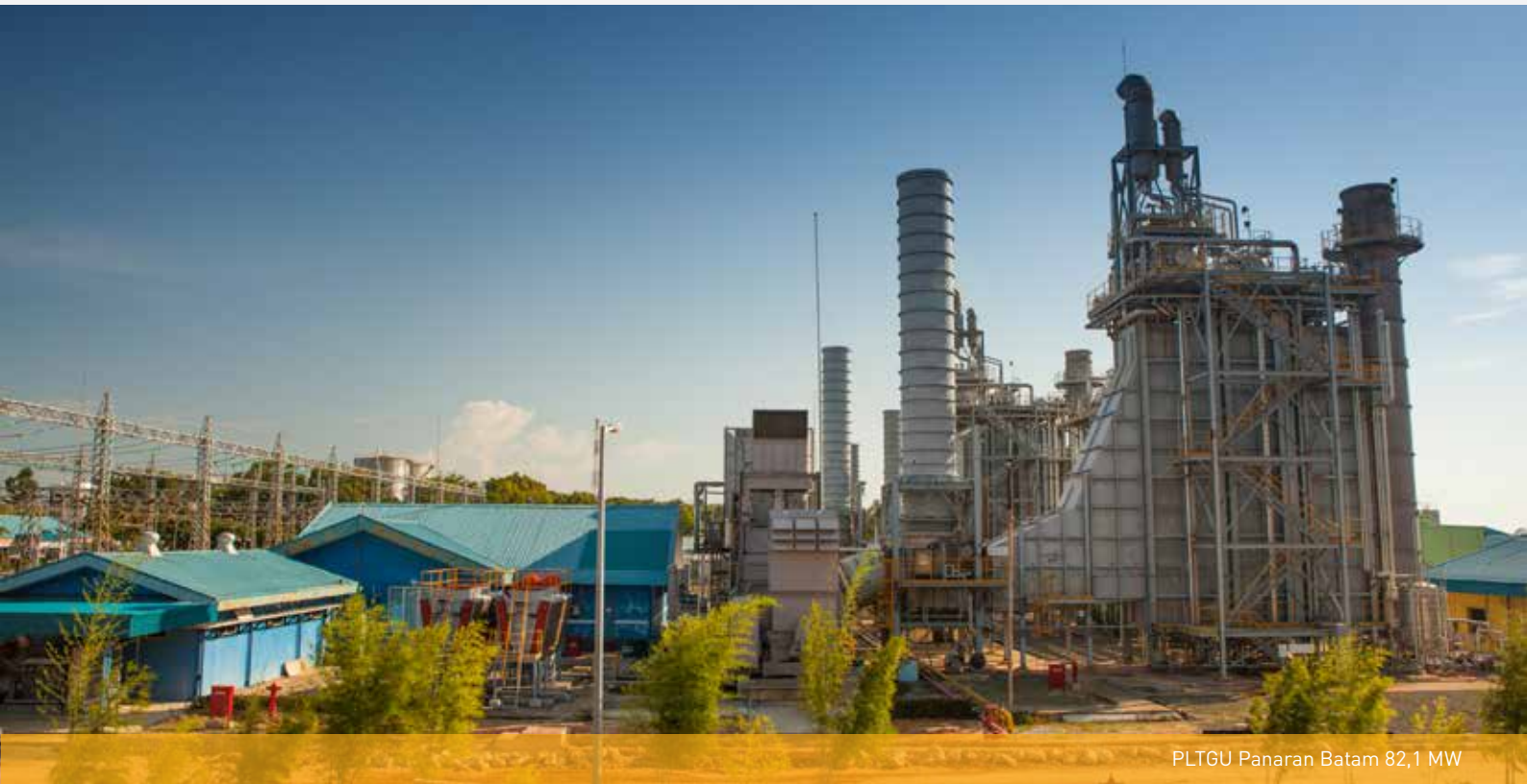
PLTGU Panaran Batam 82,1 MW