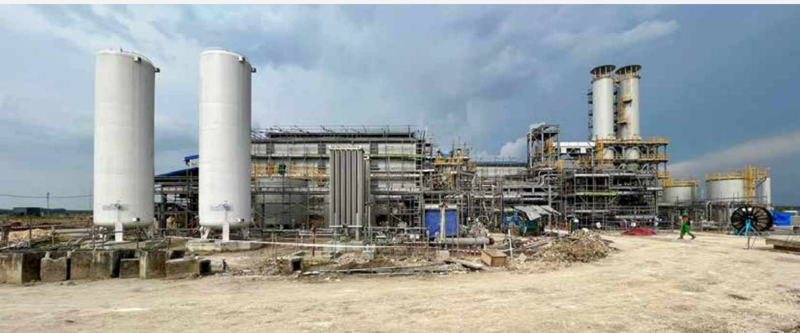
Instalasi Bleed WTP di Gas Processing Facility Jambaran Tiung Buri milik PT Pertamina EP oleh PT EMI