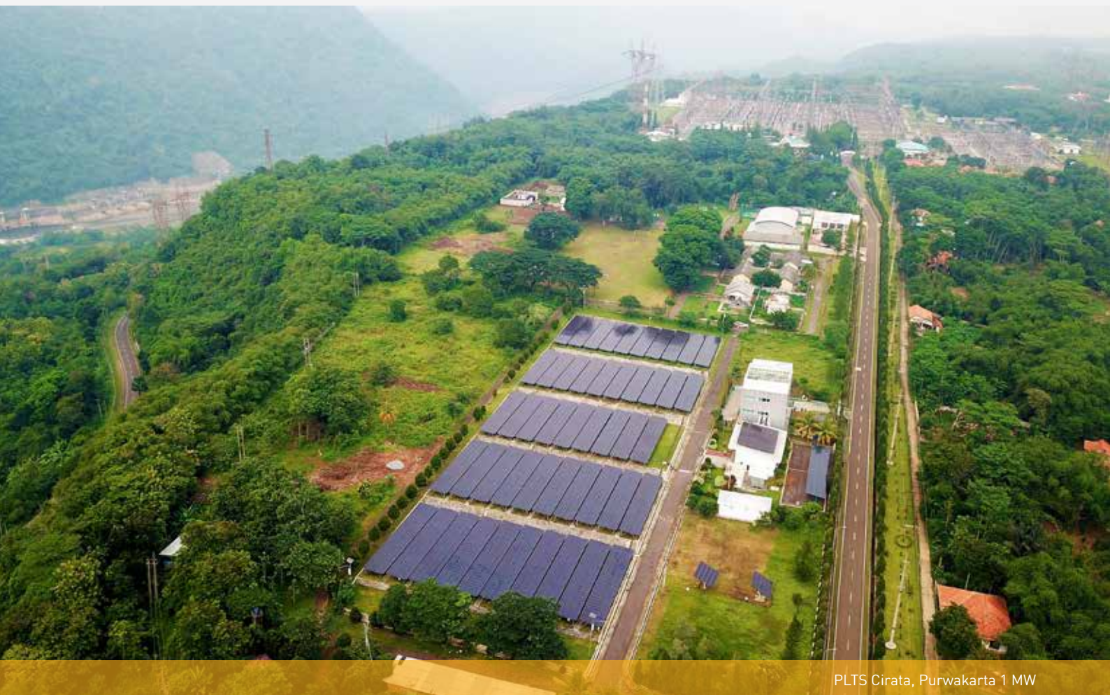
PLTS Cirata, Purwakarta 1 MW