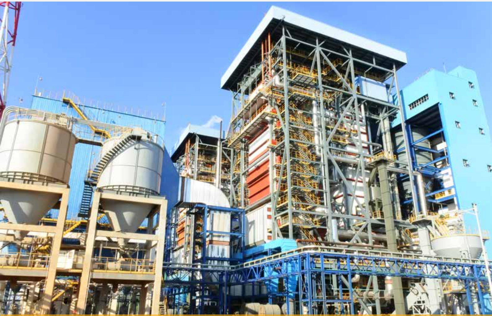
PLTU 3 Parit Baru Bengkulu