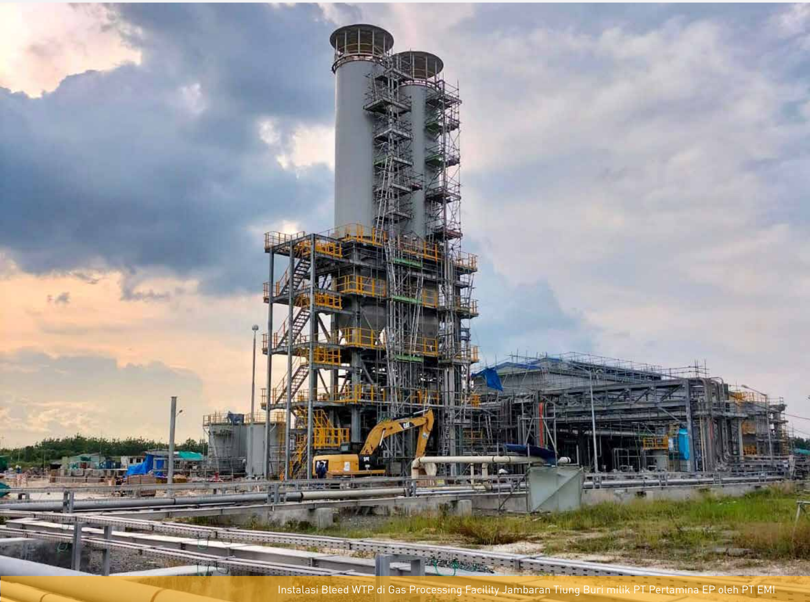
Instalasi Bleed WTP di Gas Processing Facility Jambaran Tiung Buri milik PT Pertamina EP oleh PT EMI