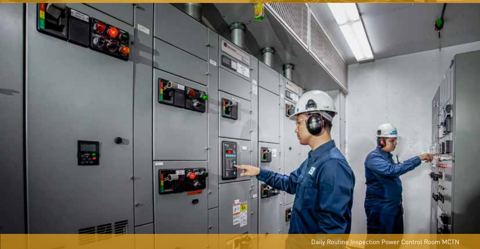
Daily Routine Inspection Power Control Room MCTN