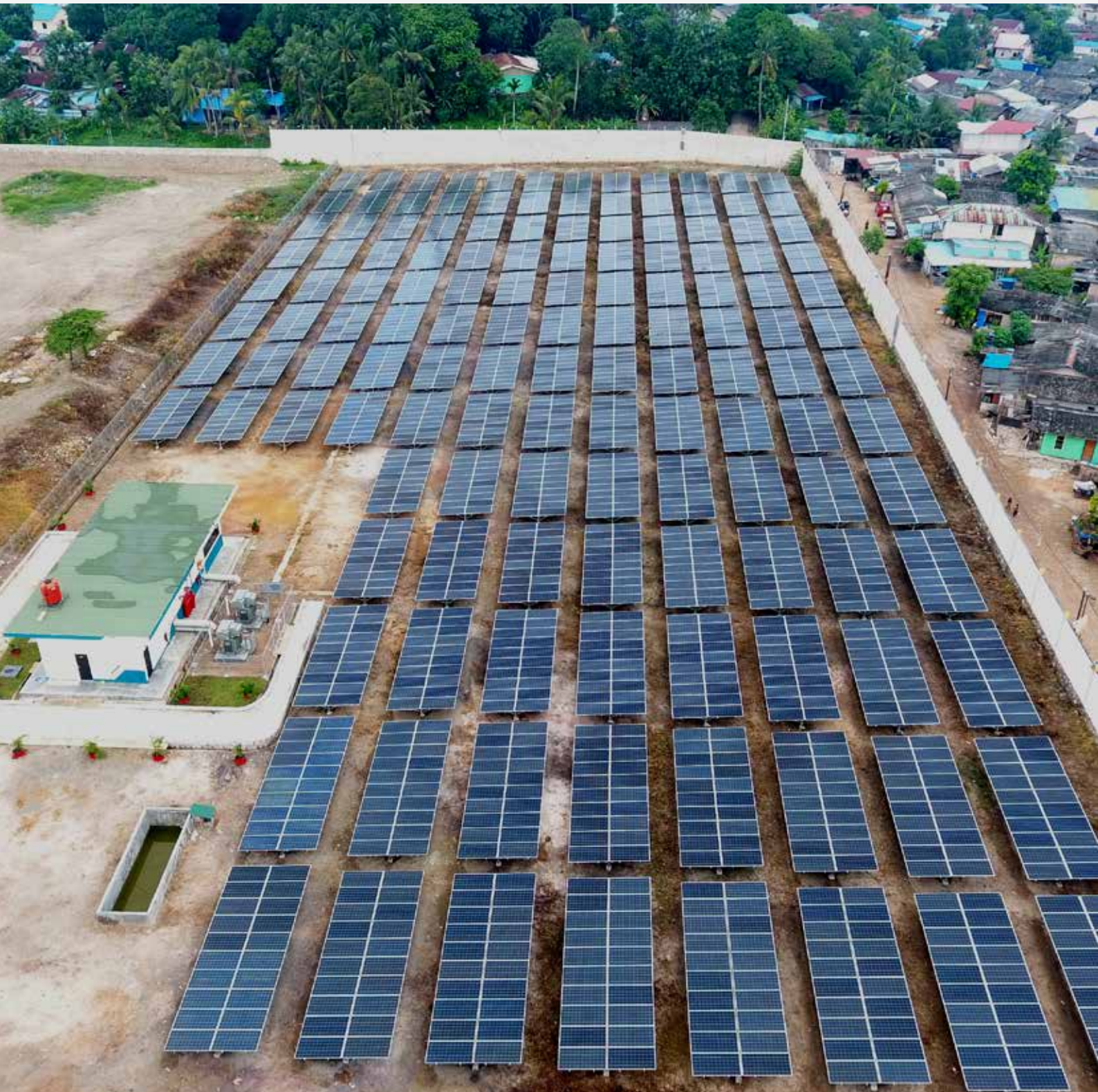
PLN Batam PLTS 1 MW Tanjung Uma