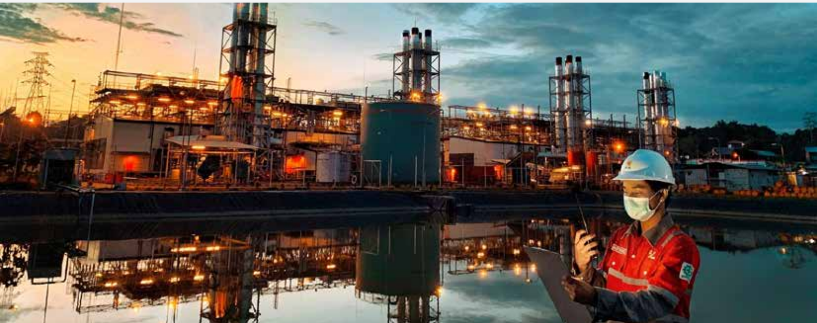
Operation & Maintenance PLTG Bengkanai