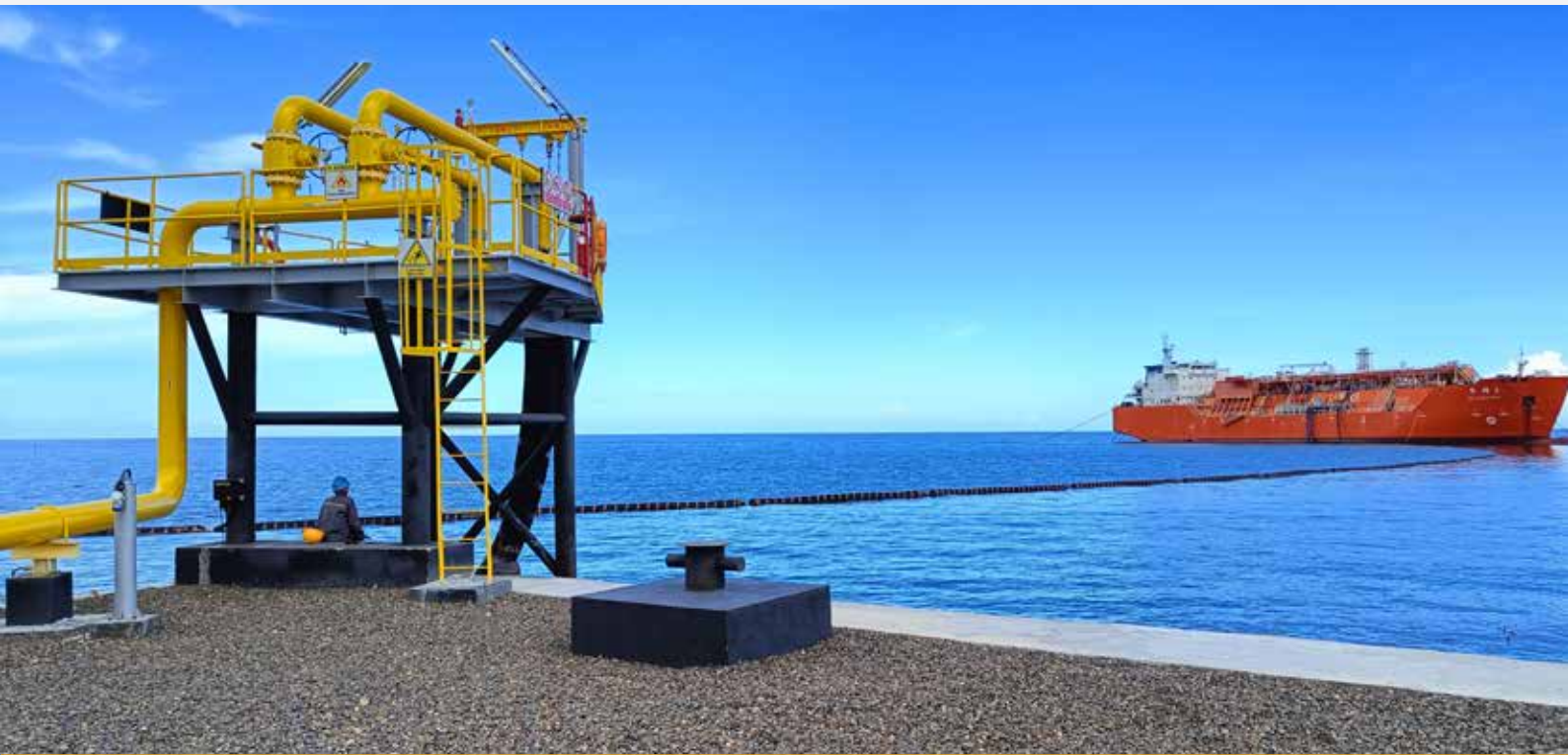
Platform FSRU Gorontalo (PLN Gas & Geothermal)