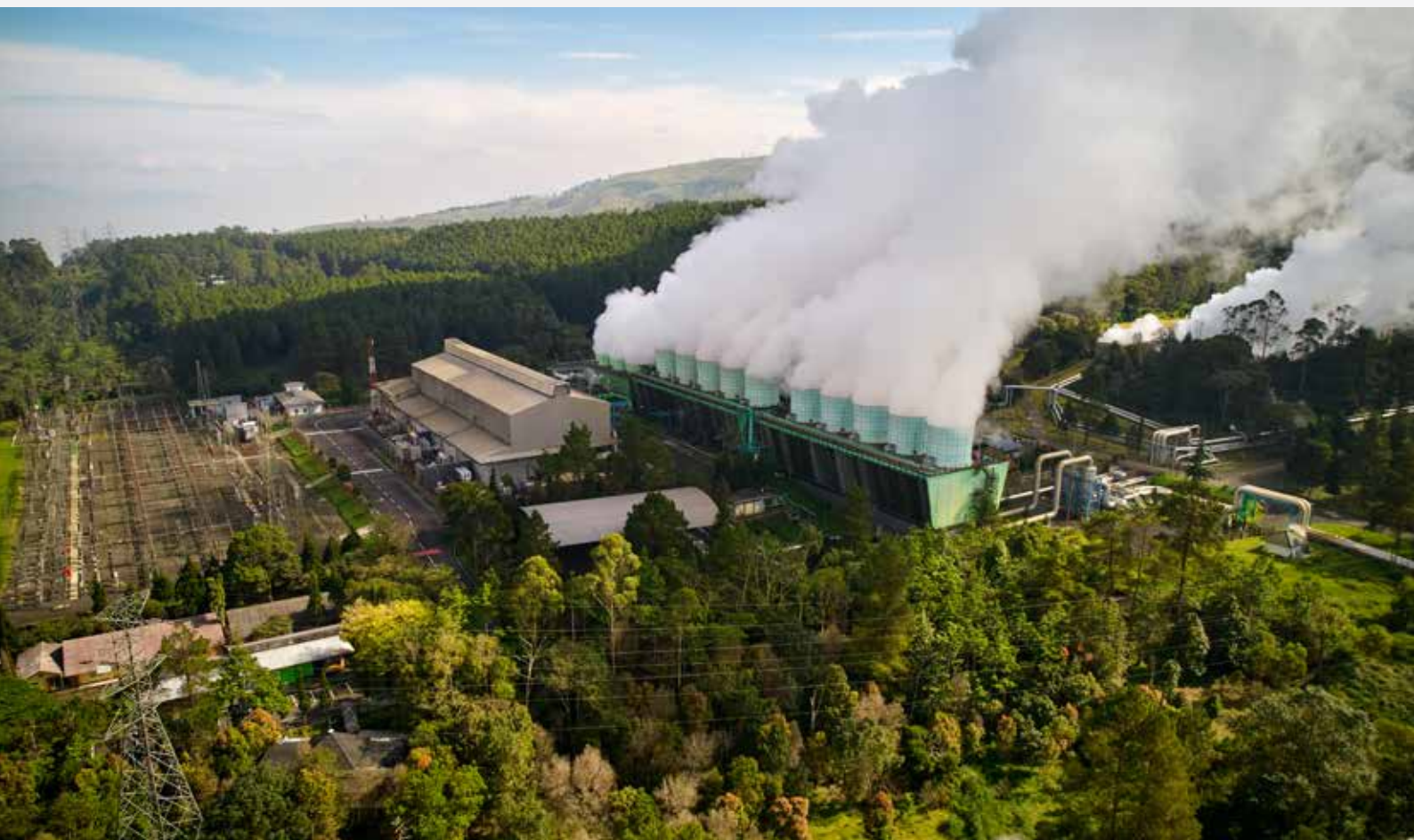
PLTP Kamojang Garut 377 MW