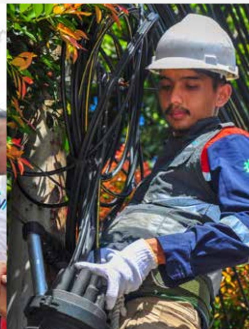
Bisnis Jaringan Internet/Internet Business Network (ICONNET)