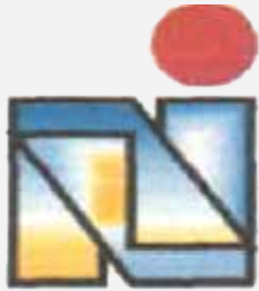
PT Navigat Innovative Indonesia