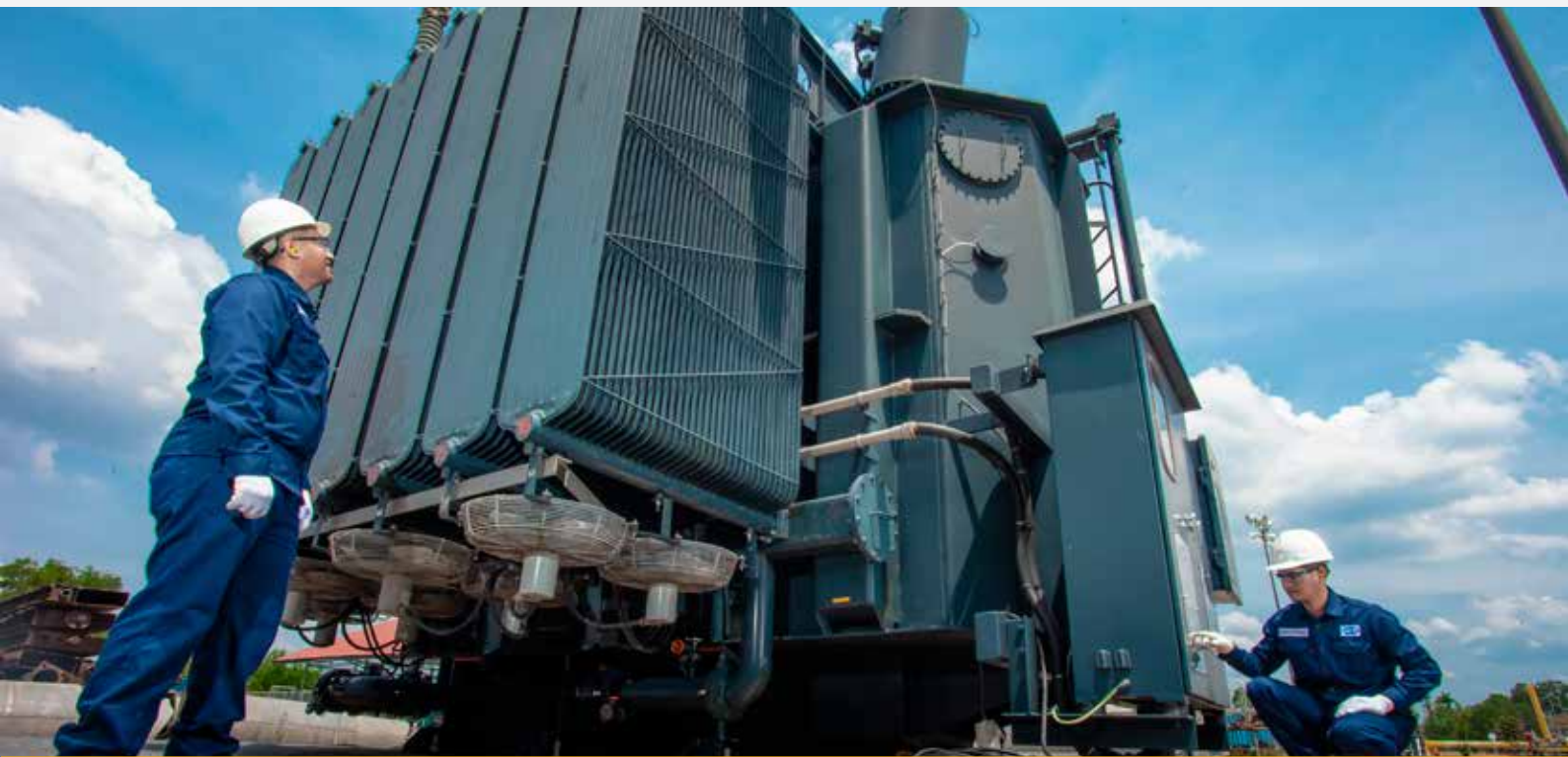
Inspeksi bulanan pada trafo 125 MVA/Monthly inspection of transformer 125 MVA