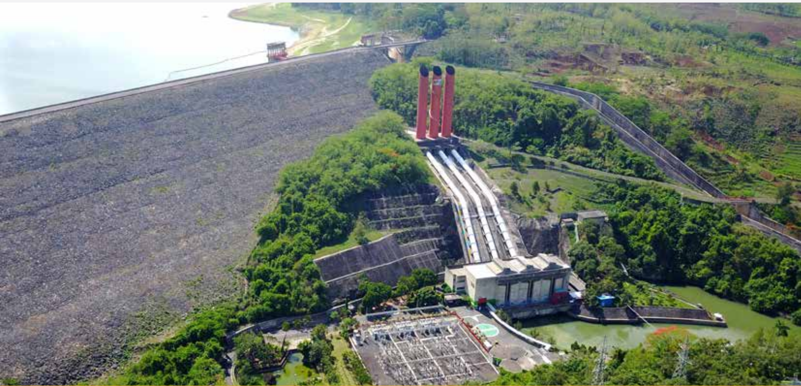
PLTA Sutami, Malang 3x35 MW